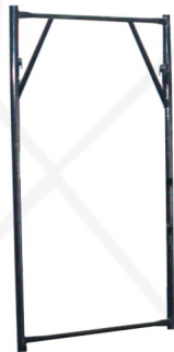
Quadro sem escada QVS

Pintura e revestimento de fachadas; Obras de reformas em geral; Manutenções prediais e industriais.