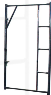
Quadro com escada QVE